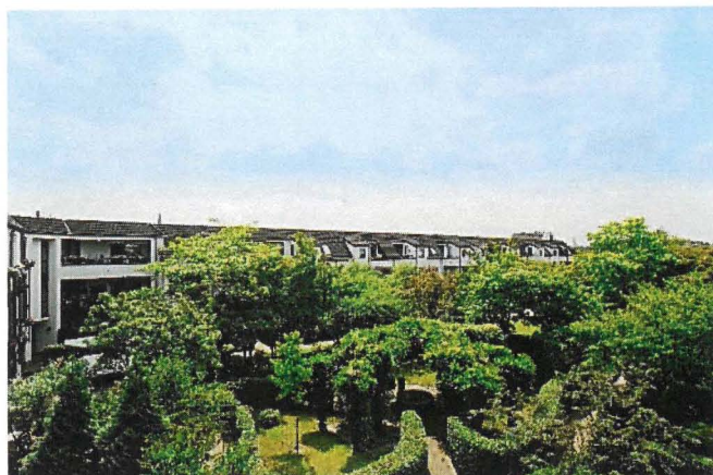
Der 5000 m 2 große Dachpark des Hanseanum ist ein Paradies mitten in der Krefelder City

„Wir haben hier ein motiviertes Team, das mit Herz und Liebe die